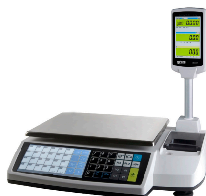
Serie M5 -30 P