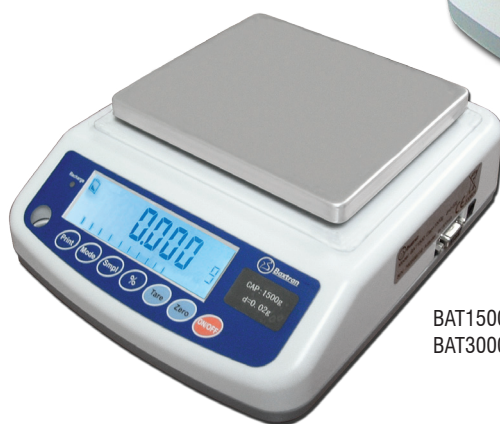
BAT1500 - 260113 BAT3000 - 260115