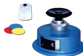
Cortador de muestras